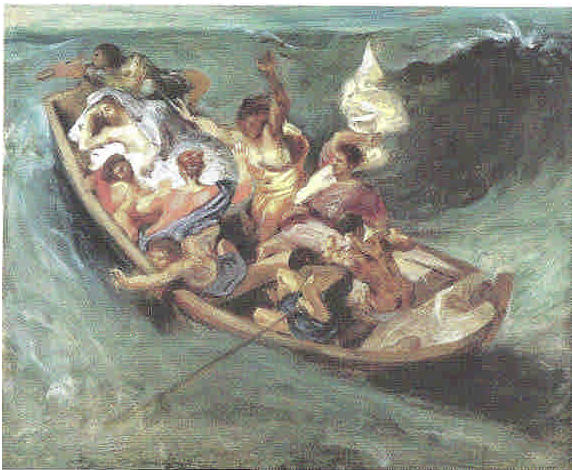
Illustration 2 : Eugène Delacroix : la barque du Christ sur la lac de Tibériade, vers 1841 ; huile sur toile de lin, 45,7x54,2 cm, Kansas City, Nelson Atkins Museum of Art.

De fait, Delacroix a renforcé le danger des eaux du lac par les couleurs données et l'horizon placé très haut. Observé purement en terme de surface, — et donc en laissant en dehors la perspective spatiale — le bateau est en effet déjà entouré d'eau de tous les côtés, comme si déjà le naufrage était survenu. La lumière d'une vert lumineux de l'eau se trouve en contradiction singulière avec le ciel chargé et couvert de ténèbres. Selon Marc, le voyage commence au soir et s'accomplit donc durant la nuit. Autrement donc que la chaude lumière qui émane de l'aura qui entoure le chef du Christ, comme une couronne solaire, et rayonne dans la plus profonde retraite, cette luminosité froide et angoissante remonte du fond de la mer et donne une impression irréelle. 5 Le mont noir à l'arrière-plan agit de manière plutôt abrupte et repoussante. Pas une fois, ces traînées lumineuses étroites qui s'esquivalent ne sont porteuses d'espoir.