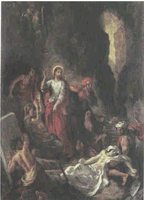
Illustration 3 : Eugène Delacroix : Le réveil de Lazare, vers 1850 ; huile sur toile de lin, 61,5x50,5 cm, New York, Bâle Kunst Museum .

Certes, le réveil de Lazare a lieu bien plus tard que l'apaisement de la tempête sur le lac. Néanmoins, maintes chose parlent en faveur du fait que Delacroix voulût mettre en rapport d'une certaine manière l'événement de Lazare d'avec la scène sur la barque. En 1850, Delacroix achève un tableau intitulé « La résurrection de Lazare » (Illustration 3), sur lequel Lazare adopte la même position, à vrai dire inversée latéralement : avec la tête inclinée sur l'épaule gauche et le bras courbé en arrière. Cette attitude corporelle souligne l'absence de vie du corps qui est tombé comme mort. Dans l'image de la tempête sur le lac, la figure se détache d'une façon plus schématique par cette attitude du bras et de la tête en addition à celles du Christ. La façon dont le Christ soutient sa tête est au fond en effet bien impossible chez quelqu'un qui dort. On pourrait dire en tout cas, qu'il dort en étant « hautement éveillé ». 11 Dans l'image de détail (Illustration 4) il peut sembler même en tout