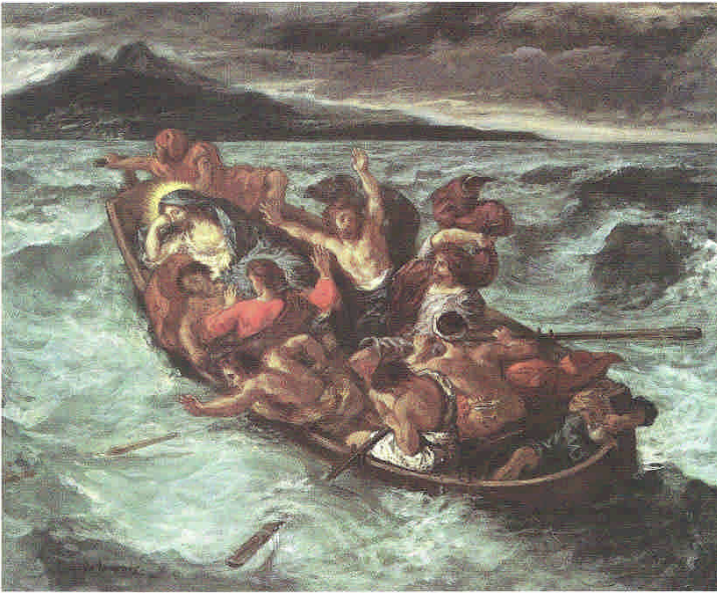
Illustration 1 : Eugène Delacroix : la barque du Christ sur la lac de Tibériade, vers 1853 ; huile sur toile de lin, 50,8x61 cm, New York, Metropolitan Museum of Art , H.O. Havemeyer Collection.

crainte, et ils se disaient entre eux : qui donc est-Il, celui-ci, que même le vent et la mer lui obéissent ? »